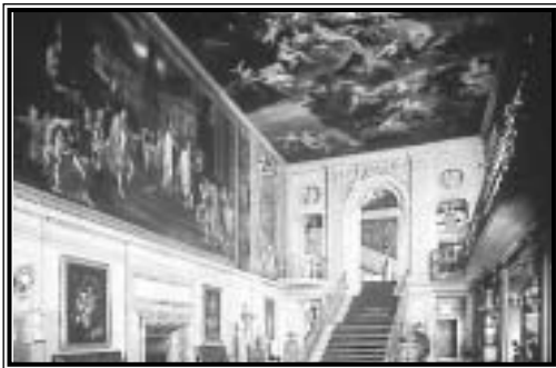
Freskókkal díszített fogadóterem Chatsworthben

MI: nevezetes helyszín. HOL: 241 km-re Londontól északra, 6 km-re Bakewelltől keletre; www.chatsworth.org. ÁR: belépőjegy. MIKOR: mindennap, márc. 15.–dec. 23. LEGINKÁBB: máj.-ban és szept.-ben a legszebbek a kertek.