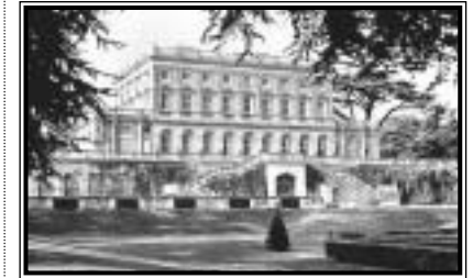
Cliveden Buckingham második hercege építtette 1666-ban

MI: szálloda, étterem. HOL: 16 km-re Windsortól északnyugatra; www.clivedenhouse.co.uk . MIKOR: csak vacsora, mindennap.