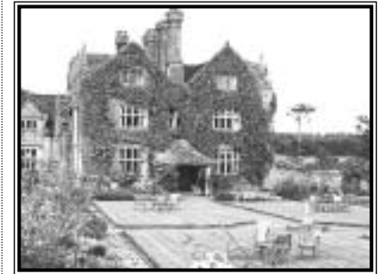
A Gravetye udvarházhoz egy 400 hektáros birtok tartozik

MI: opera-előadások, szálloda, étterem. GLYNDEBOURNE-I OPERAFESZTIVÁL: 2 km-re Lewestől keletre, 88 km-re Londontól délre; www.glyndebourne.com. Mikor: máj. közepé- aug. Elővétel: márc. Jegyek máj.-ban és aug.-ban is kaphatók. GRAVETYE UDVARHÁZ: East Grinstead, 32 km-re a nyugat-sussexi Glyndebourne-tól északnyugatra, 48 km-re London-