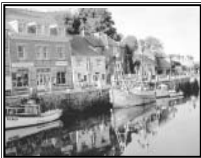
Üzletsor a padstow-i kikötőben

hogy megfelelő legyen az alapanyag a haléltalon szereplő fogásokhoz.