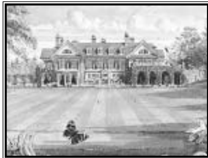
Chewton Glen-t a második világháború után alakították át szállodává

Winchesterbe. Aki nem akar kimozdulni, kényeztetheti magát a nemrég elkészült élményfürdőben, majd megvacsorázhat a szálló Marr-yat termében – a vendégek ritkán mulasztják