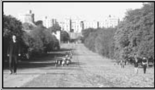
A windsori kastély a sétány felől

uralkodó, II. Erzsébet, gyermekkorá java részét itt töltötte, érthető tehát, hogy nagyon fájdalmasan érintette, amikor 1992-ben tűzvész martaléka lett száz szoba – ezek részben hivatalos helyiségek voltak, részben pedig magánlakosztályok. Az 1997-re befejezett, 53 millió dollárt felemészítő helyreállítás során a mesteremberek a rekonstrukció alatt ugyanazokkal a technikákkal dolgoztak, mint kilencszáz évvel korábban, Hódító Vilmos idején a kastély építése során. A későbbi időkben nyolc egymást követő uralkodóház tagjai el-