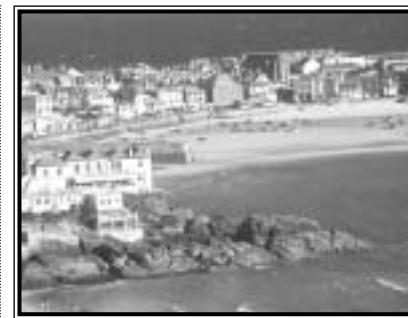
One of Cornwall's beguiling coves

MI: város, nevezetes helyszín. ST. IVES: 515 km-re Londontól délnyugatra, 34 km-re Land's Endtől északkeletre. TATE GALLERY: Porthmeor Beach; www.tate.org.uk. Mikor: márc.–okt. mindennap, nov.–febr.: hétfőn zárva.