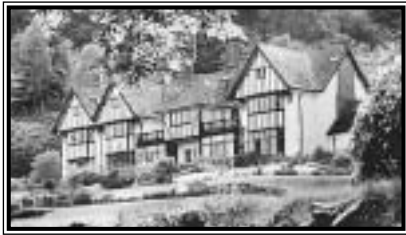
A 16. századi alapokra épült Gidleigh Park

amióta csak megnyitotta kapuit 1977-ben – kevés más hely tud versenyezni inyenceknek szánt ételsoraival vagy a csodálatos környezettel.