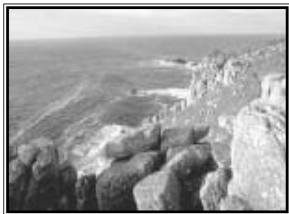
Ahol a La Manche csatorna és az Atlanti-óceán szétválik

A több mint száztagú sziklás szigetcsoport (közülük öt lakott, számosnak pedig legalább nevet adtak) egzotikus pálmáinak, különleges madárvilágának és gyönyörű, homokos tengerpartjainak köszönheti vonzerejét. Az 1834