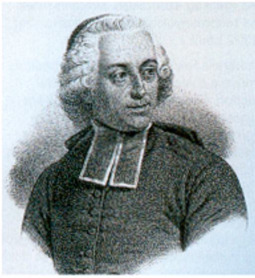
Étienne Bonnot de Condillac, korabeli kép alapján készült krétalitográfia, 19. század első fele, Bibliothèque Nationale, Párizs

A szenzualizmus (a latin sensus , azaz „érzék” szóból) megalapítója, Condillac abból indul ki, hogy minden megismerés érzéki tapasztalaton nyugszik, és nincs lényegi különbség az érzékelés és a gondolkodás között. Locke, akire a szenzualizmus támaszkodik, különbséget tett egyszerű és összetett ideák között. Az egyszerű ideák a külső és belső észlelésből erednek, azaz külső tárgyak észleléséből, és a lélek ezáltal előidézett tevékenységéből. Locke tehát részben a lélek saját alkotó tevékenységéből indul ki. Épp ezt vitatja Condillac. Szerinte minden egyszerű benyomás kívülről származik. Amennyiben a tudatban több érzéki benyomás összetalálkozik, akkor van meg a lélek tevékenységének kiinduló feltétele, azaz a lélek nem önállóan tevékeny.