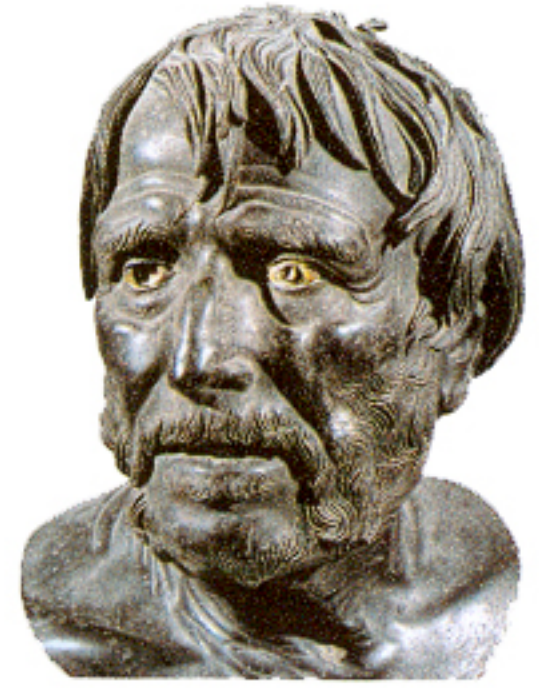
Pszeudo-Seneca, görög eredeti nyomán készült római másolat, bronz, Museo Nazionale Archeologico, Nápoly

individuális emberi, állati vagy növényi lélek van elgondolva; azáltal, hogy az egész világot áthatja, a kozmoszt egységes organizmussá formálja. Ez után következnek a testi világ, a konkrét dolgok tökéletlen hiposztázisai, amelyeket Plótinusz – mivel az anyagot rosszként határozza meg – ontológiailag leértékel. Ezzel leteszi egy hosszú tradíció, a testhez való ellenséges viszony alapjait. Az ember legfőbb etikai és szellemi célja az Ős-Egygel való, racionalitáson túli egyesülés, egyfajta unio mystica (misztikus egység), amelynek feltétele a kizárólag szigorú aszkézis által elérhető elszakadás minden testitől. Boethius, mint sok más újplatonikus gondolkodó, Platón és Arisztotelész filozófiáját egyetlen egységnek tekinti, s feladatát alapvetően abban látja, hogy műveiket latinra fordítsa és kommentálja. Az Arisztotelész Organon jához írt kommentárok fordításával Boethius válik az antik logika közvetítőjévé a középkor felé. Mikor Theodorik felségárulás vádjával börtönbe veti, megírja Filozófiai vigasztalások című művét, amelyben a földi javakat értéktelennékként jellemzi, és Istent mint a legfőbb jót magasztalja.