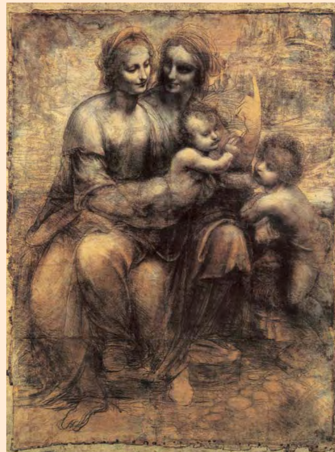
Szent Anna harmadmagával. 1499–1500 (?). London, National Gallery

A bevezető tanulmányt harmincnégy tételből álló oeuvre-katalógus követi, amely a legújabb kutatási eredmények alapján értel-