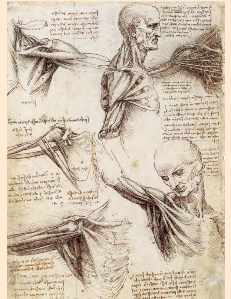
A váll és nyak mozgásainak anatómiai elemzése. 1509–1510 körül. Windsor Castle, Royal Library