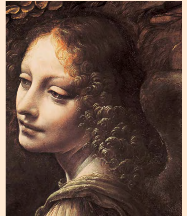
Szűz Mária (részlet). 1495–1499. London, National Gallery

Magyarul is megjelenik a TASCHEN Kiadó lenyűgöző kiadványa, a különlegesen nagy méretű és az eddigi legteljesebb összefoglaló munka az olasz reneszánsz géniuszáról, aki festő, szobrász, építész, mérnök volt egy személyben.