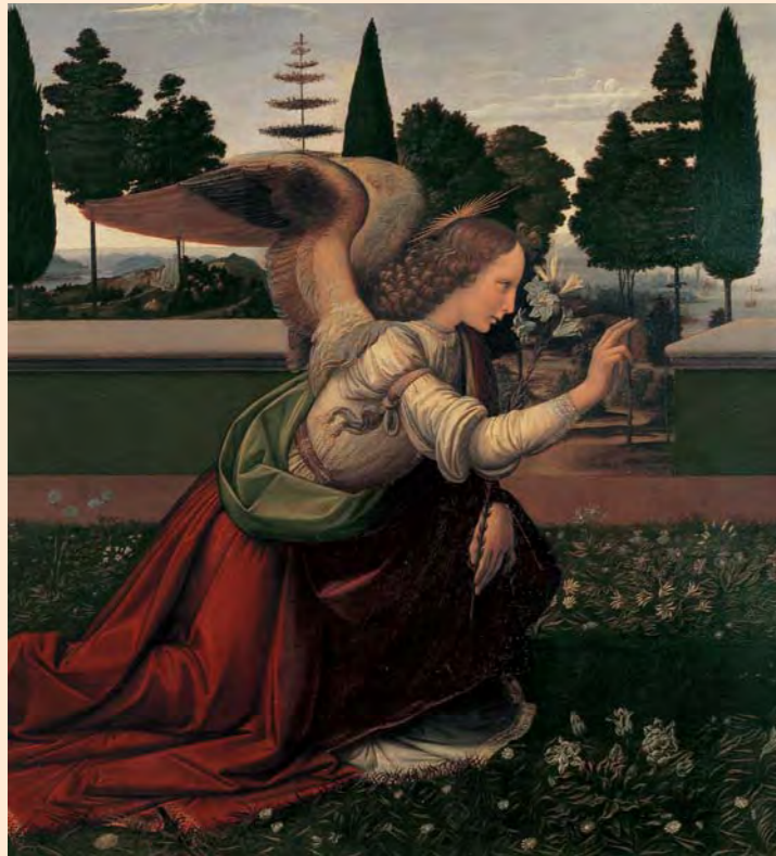
Angyali üdvözlés (részlet). 1473–1475 körül. Firenze, Galleria degli Uffizi

mezi a fennmaradt és elveszett festményeket. A bibliográfia első alkalommal tartalmazza a művek állapotának, technikájának, tervezési folyamatának, származásának, attribúciójának és az ábrázolások forrásának teljes jegyzékét.