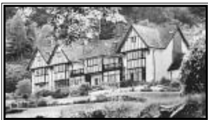
A 16. századi alapokra épült Gidleigh Park

amióta csak megnyitotta kapuit 1977-ben – kevés más hely tud versenyezni inyenceknek szánt ételsoraival vagy a csodálatos környezettel.