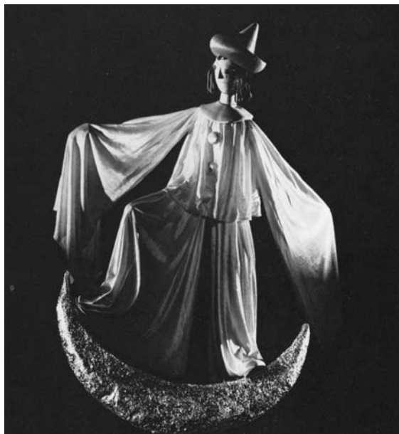
Két Pierrot-játék, 1979

A sajtó az ünnepi eseménynek kijáró tisztelettel emlékezik meg a bemutatóról. Persze a recenziók némelyikéből nem hiányzik a hajdani nagy sikerekre, A fából faragott királyfira és A cso-