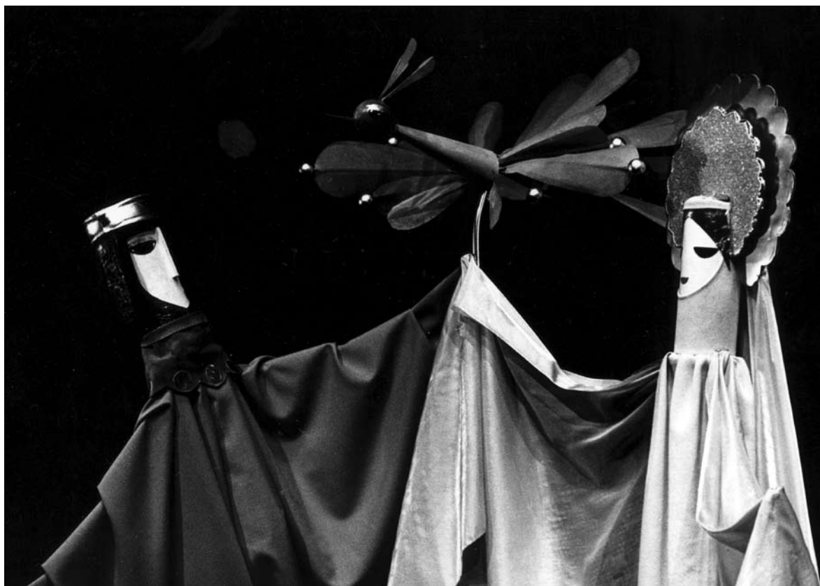
Tűzmadár , 1982

Amennyire a bábfigurák alkalmasak lehetnek elvont – akár zenei – gondolatok közlésére, ugyanannyira fennáll annak a veszélye is, hogy a látvány – ha mégoly bravúros is, – pusztá illusztrációvá válik. Sztravinszkij Petruskája a maga népi mozgalmasságával reveláció volt ebben a színházban annak idején, most azonban az egykori siker ihlette másik Sztravinszkij-adaptáció, a Tűzmadár megmutatott csupán egyfajta lehető-